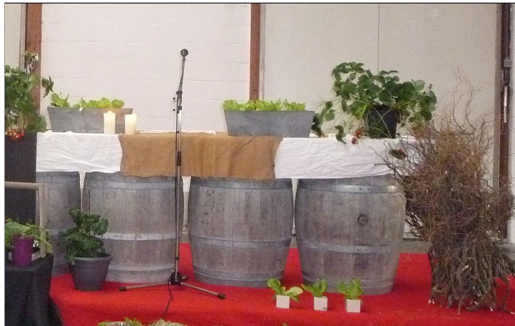
Een kruisdagviering heeft plaats op een land- of tuinbouwbedrijf. Met wat voorhanden is, wordt het altaar gemaakt en de ruimte aangekleed.

Iedereen is van harte welkom om er samen een stemmige viering van te maken. Wie dat wil kan na de viering nog even blijven napraten - al dan niet met een glas in de hand.